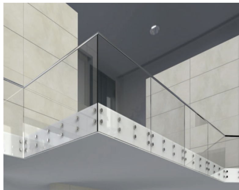
SAMONOŚNE NA ROTULACH