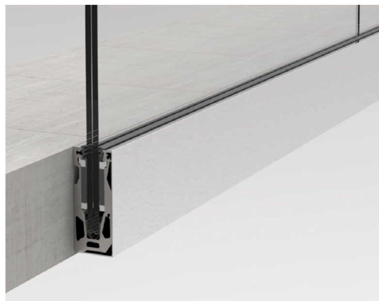
DO CZOŁA (od boku)