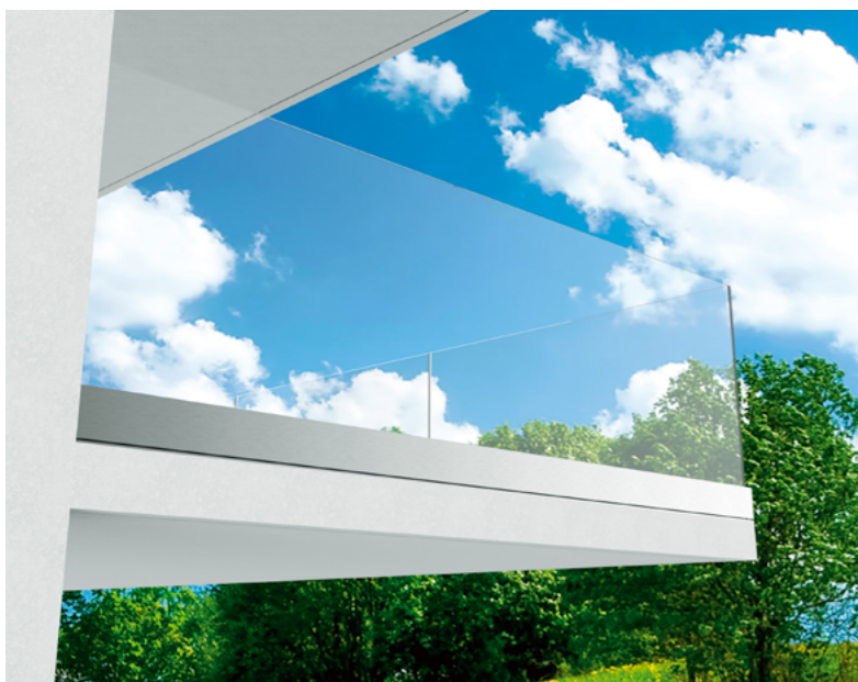
SAMONOŚNE W PROFLU