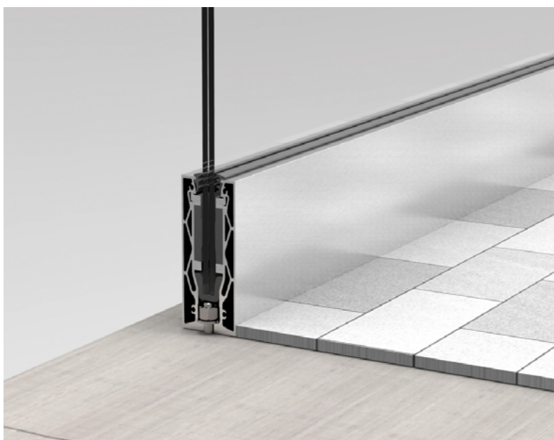
NA PŁYTY (od góry)