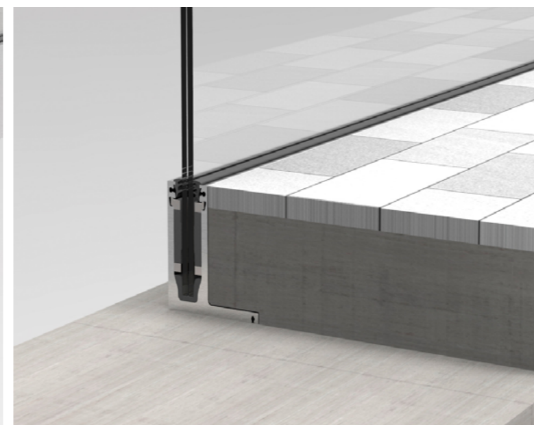
ZATOPIENIE W POSADZCE