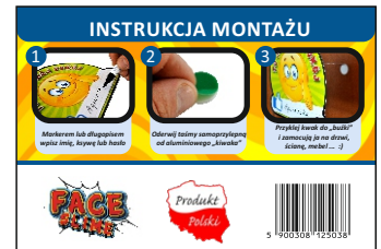
Dołączona szczegółowa instrukcja montażu