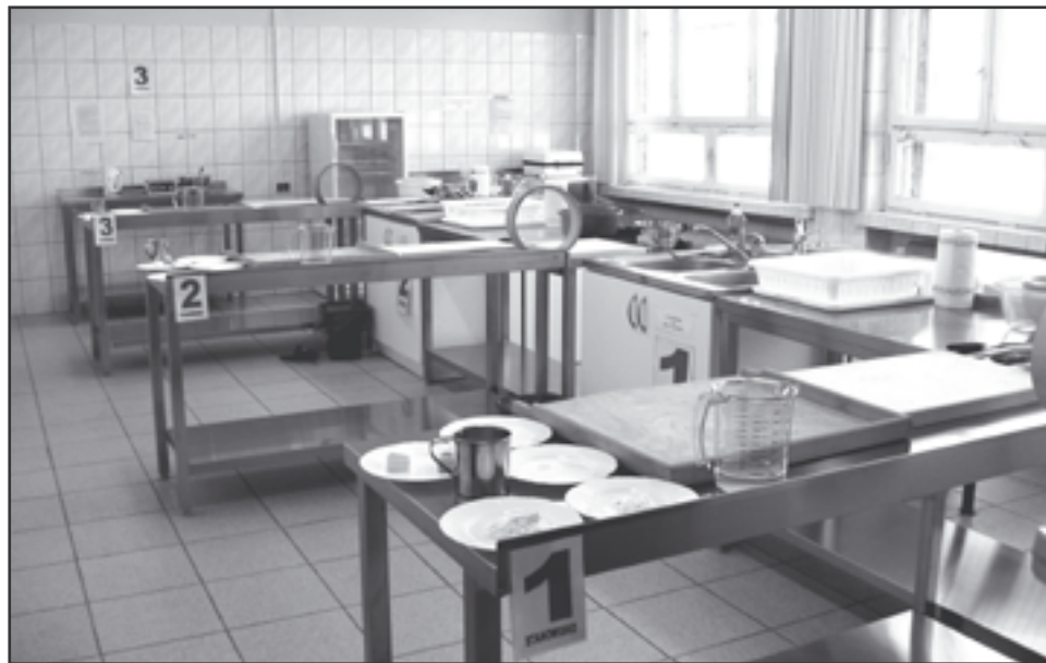
CKP na piątkę przygotowane jest do egzaminów

Egzamin zewnętrzny w zawodówkach i technikach ma na celu obiektywne, bezstronne sprawdzenie umiejętności i wiedzy ucznia, dlatego egzaminator nie może być jego nauczycielem, czy pracownikiem szkoły, do której uczeń uczęszczał. Musi natomiast zdobyć odpowiednie kwalifikacje: odbyć kurs, sam również zdać egzamin i dopiero potem uzyskać uprawnienia nadawane przez Okręgową Komisję Egzaminacyjną. To z niej w za-