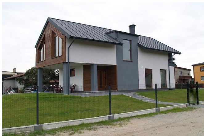
Budowa domu jednorodzinnego w Imielinie