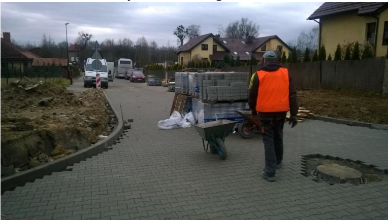
Budowa ulicy Jaworowej w Pyskowicach