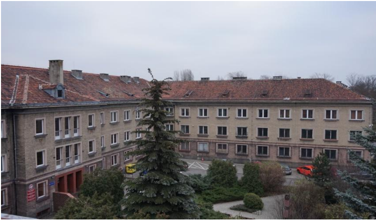
Przebieg roczny budynku Urzędu Miasta w Pyskowicach