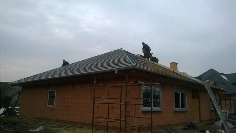
Budowa domu jednorodzinnego w Łanach Wielkich