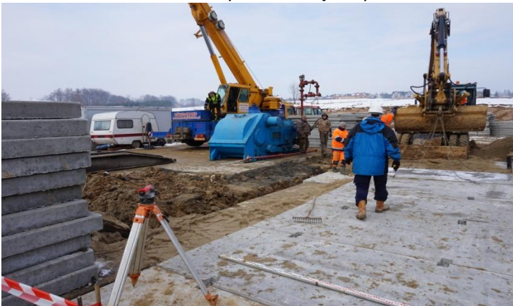
Prace przygotowawcze dla wykonania odwiertu gazowego Kowale w miejscowości Rudzica