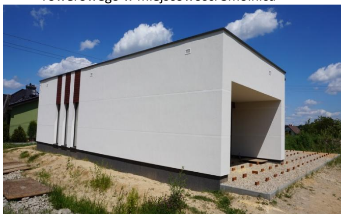
Budowa domu jednorodzinnego w Bytomiu - Radzionkowie