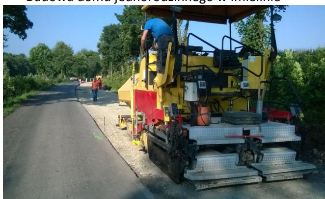
Przebudowa drogi powiatowej nr 2916 S Żernica Smolnica – etap II wraz z budową ciągu pieszo – rowerowego w miejscowości Smolnica