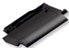
NUANCE antracytowa angobowana