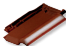
NOBLESSE brązowa glazurowana