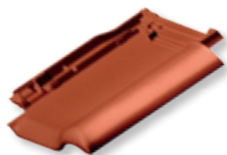
NUANCE miedziana angobowana