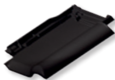
NUANCE czarna matowa angobowana

Przedstawione wzorce kolorów ze względu na zastosowane techniki drukarskie mogą różnić się od rzeczywistych, w związku z czym należy traktować je poglądowo.