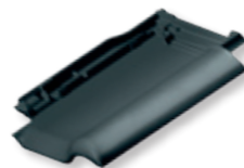
NUANCE w kol. łupka angobowana