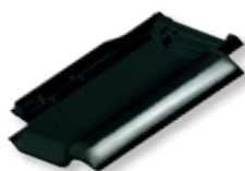
FINESSE czarna glazurowana