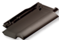
NUANCE ciemnobrązowa angobowana