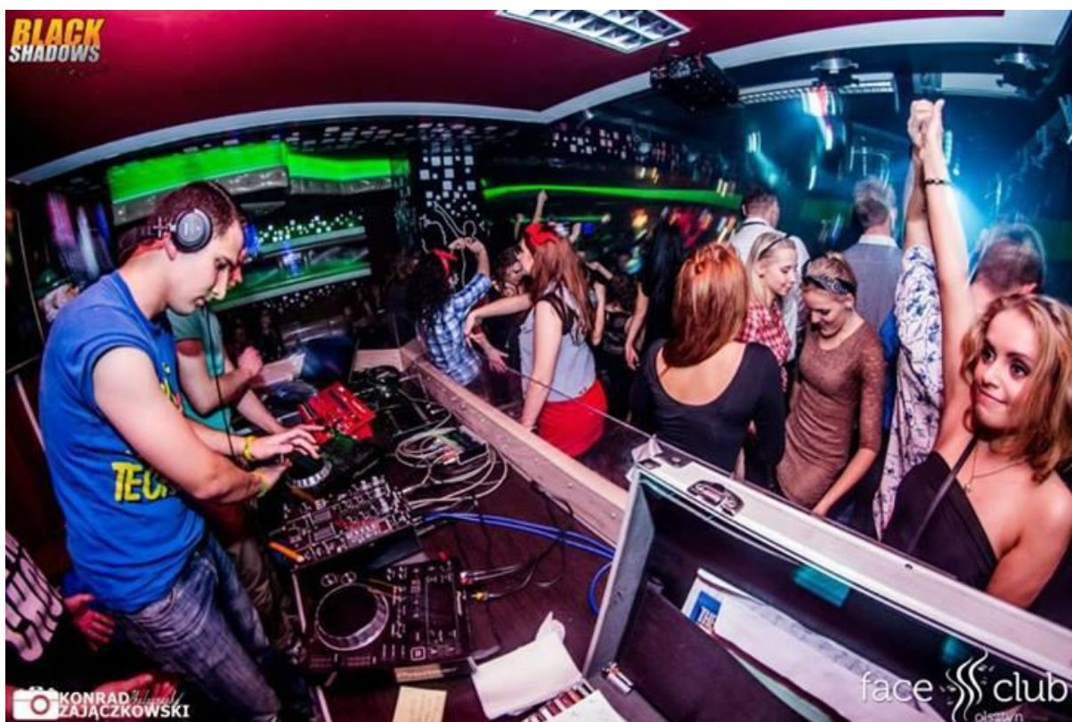
Otrzęsiny WNS Face Club 2013