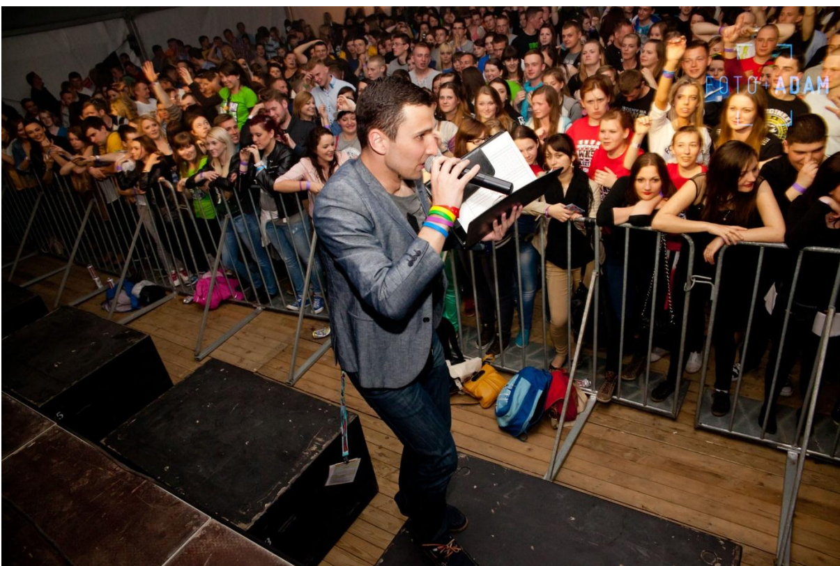
55 Kortowiada Olsztyn 2014