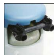
Bypass z zaworem mieszającym (opcja)

Zmiękczacze serii Slimeline wyróżniają się w gamie kompaktowych zmiękczaczy. Nowoczesny design, staranne wykonanie oraz ekskluzywne rozwiązania w połączeniu z licznymi funkcjami technicznymi zadowolą nawet najbardziej wymagających użytkowników. Dostępne są następujące modele: 11 (Mini), 17 (Midi) i 24 (Maxi) w konfiguracjach TempoPlus i EcoPlus. Urządzenia serii Slimeline cechuje: