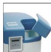
Oddzielna pokrywa ułatwia zasyp soli