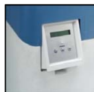
Zintegrowany panel sterowania

Automatyczne stacje uzdatniania wody działające w oparciu o zjawisko wymiany jonowej mogą być stosowane zarówno w instalacjach domowych, jak i w obiektach użyteczności publicznej, gastronomicznych, hotelowych oraz w zakładach przemysłowych. Obniżenie twardości ogólnej poprzez zatrzymanie jonów wapnia i magnezu na wysokowydajnym złożu pozwala na zastosowanie SUW do celów kotłowych i ochrony urządzeń grzewczych. Akurat podgrzewanie wody intensyfikuje proces wytrącania się twardych osadów (kamienia kotłowego) w rurach, podgrzewaczach, sprzęcie gospodarstwa domowego. Podobne skutki zachodzą też podczas odparowania wody, nawet częściowego, (nawilzacze, filtry powietrza, chłodnie). W takich przypadkach nawet stosunkowo niewielka zawartość substancji tworzących kamień kotłowy może z upływem czasu doprowadzić do poważnych problemów.