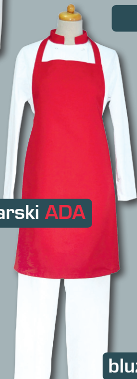
fartuch kucharski ADA