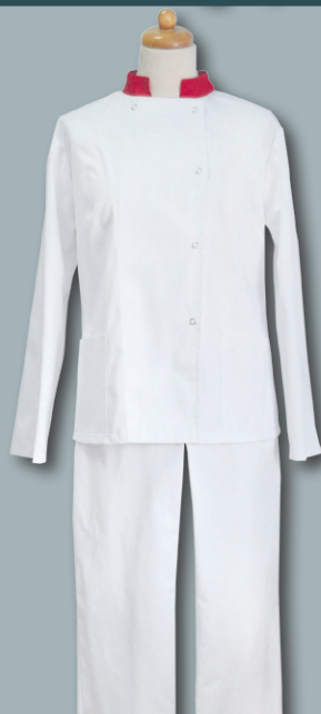
bluza kucharska damska DOROTA

Bluzy można łączyć ze spodniami. Bluzy, fartuch i zapaski dostępne są w każdej kolorystyce z podanej tabeli kolorów.