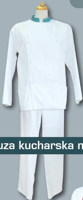
bluza kucharska męska DAWID