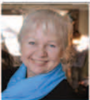
Iwona Wawer, polski naukowiec, profesor na Wydziale Farmaceutycznym Warszawskiego Uniwersytetu Medycznego i wiceprezes Krajowej Rady Suplementów i Odżywek:

Suplementy diety Vision są produkowane zgodnie ze wszystkimi wymaganymi standardami (GMP- Dobra Praktyka Produkcyjna i GLP- Dobra Praktyka Laboratoryjna), które zapewniają najwyższą jakość produktu końcowego. Największą zaletą Firmy Vision jest szeroka gama suplementów diety- w zależności od potrzeb (źródło: Vision Planet nr 5/maj 2011).