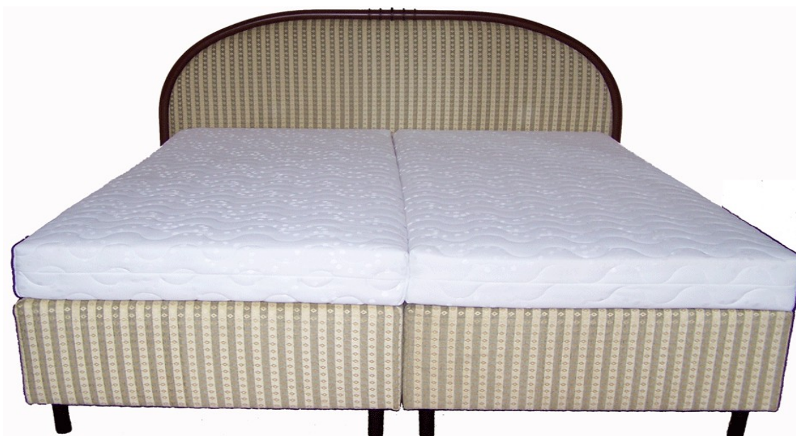
Łóżko hotelowe "Royal"

Przedmiotem oferty są łóżka hotelowe „Komfort” typ „Continental” wraz z materacem bonelowym dwustronnie pikowanym typ „Clasic”. Rama łóżka wykonana jest z litego drewna , na której umieszczony jest wkład bonelowy o wysokości 11cm.