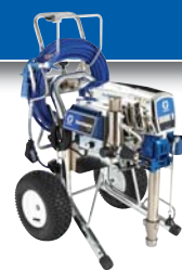
Mark V Platinum