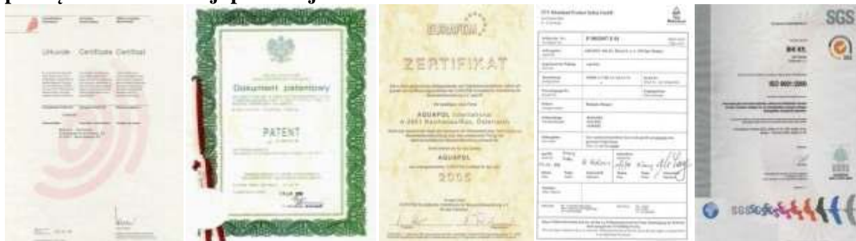
Europejski dokument patentowy Polski dokument patentowy Certyfikat EURAFEM Certyfikat TUV / EMV ISO 9001:2000

Firma AQUAPOL POLSKA CPV z siedzibą w Świebodzicach jest wyłącznym przedstawicielem w Polsce Centrali AQUAPOL GmbH w Austrii i zajmuje się wdrażaniem BEZINWAZYJNEGO SYSTEMU OSUSZANIA MURÓW, zawilgoconych w wyniku podciągania kapilarnego, spowodowanego brakiem izolacji poziomej lub jej uszkodzeniem oraz ZABEZPIECZA MURY PRZED PONOWNYM WTARGNIĘCIEM WILGOCI, pełniąc zadanie izolacji poziomej.