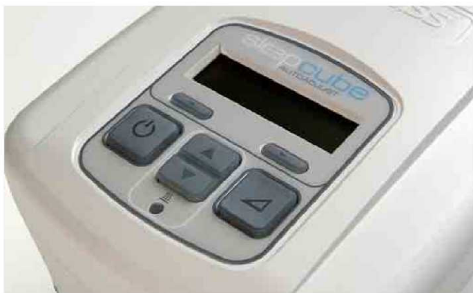
Podświetlane przyciski i wyświetlacz czynią SleepCube łatwym w obsłudze w ciemności.

Sleepcube Standard jest pierwszym w nowej gamie urządzeń do terapii snu z firmy DeVilbiss Healthcare. Aparat ten pracuje z ustalonym ciśnieniem CPAP przeznaczonym dla efektywnego leczenia OSA. Jest jednakowo odpowiedni dla użycia w domu jak i szpitalu, a jego ergonomiczny kształt i mała wielkość sprawiają, że staje się idealnym towarzyszem podróży. Uniwersalność zasilania sprawia, że może zostać faktycznie użyty, gdziekolwiek w świecie. Zasilanie 12 V DC umożliwia stosowanie także na łodzi, w samochodzie czy przyczepie kempingowej. Opcjonalny podgrzany nawilżacz powietrza w prosty sposób integruje się z aparatem i jest szybko gotowy do kojącego i orzeźwiającego snu.