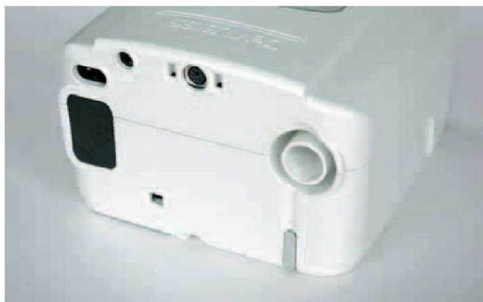
Ściana tylna SleepCube – filtr oraz podłączenie obwodu pacjenta