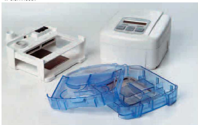
Sleepcube z integrowanym podgrzewanym nawilżaczem powietrza