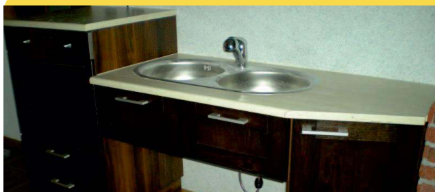
podjazd pod zlew dla osób poruszających się na wózku, umożliwiający swobodne i samodzielne korzystanie ze zlewu