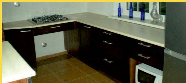
podjazd pod kuchenkę dla osób poruszających się na wózku, umożliwiający swobodne i samodzielne korzystanie z kuchenki