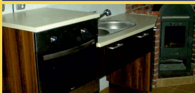
system niskich szuflad oraz obniżony piekarnik dla osób poruszających się na wózku, umożliwia swobodne i samodzielne korzystanie z zasobów ulokowanych w szufladach i szafkach oraz korzystanie z piekarnika