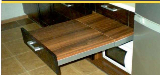
blat roboczy, niski dla osób poruszających się na wózku, ułatwiający codzienne czynności w kuchni