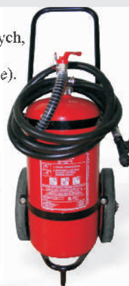
Agregat proszkowy GP-25x 040213

Ga nica przewo na GP-25x znajduje szczególne zastosowanie na stacjach paliw, w du ych zakładach przemysłowych, papierniczych, tworzyw sztucznych i włókienniczych, tartakach, fabrykach mebli itp.