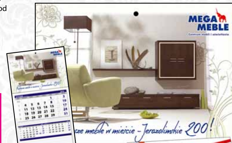
Kalendarz niestandardowy dwudzielny z żelam zapachowym i indywidualną kopertą.