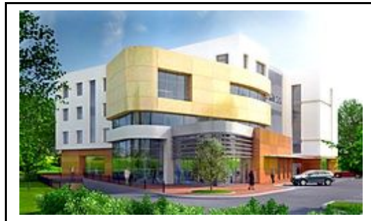
- centrum handlowe SuperValu (2007r.) -