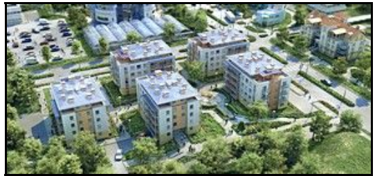
- Gdańsk (2009r.) -