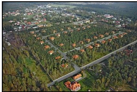
- AbbeyWood (2008r.) -