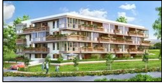
- Gdynia (2009r.) -