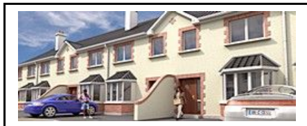
- Glounthaune (2006r.) -