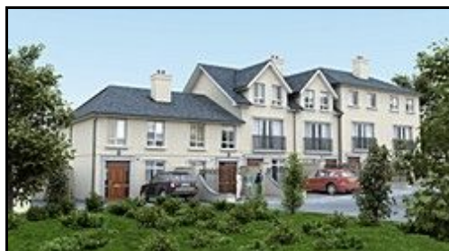
- Yelland (2008r.) -