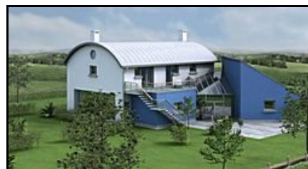
- Marina Terrace (Dubai 2006r.) -