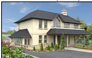
- Kilkenny (2006r.) -