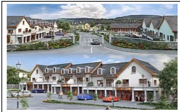
- Airside Primary Care Centre (2008r.) -