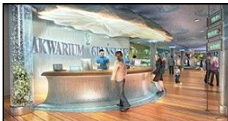
- Akwarium Morskie Gdynia (2005r.) -