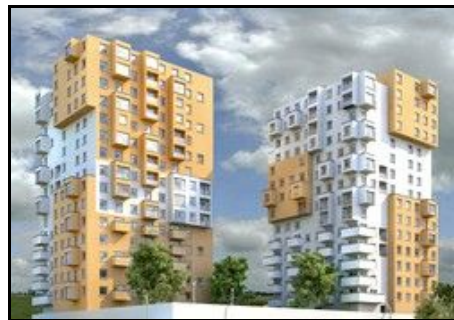
- Warszawa (2008r.) -