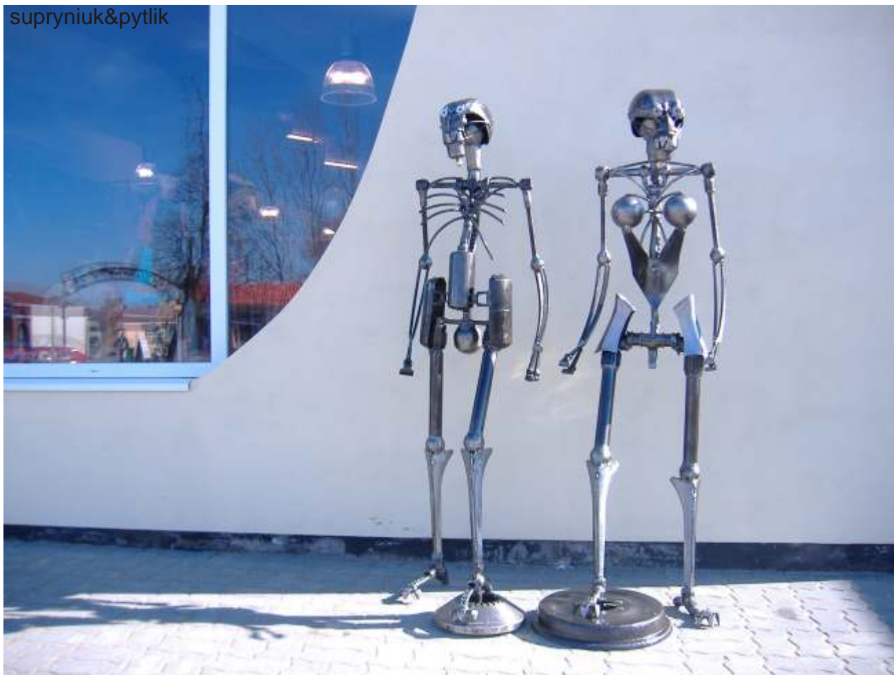
Humanoidy i rzeba ptaka zdobiące sklep Raven (Bydgoszcz, Szubin, Barcin.).