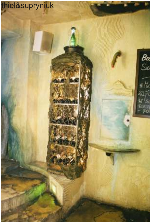
Metalowa szafa na wina (Wieloryb - Sopot).