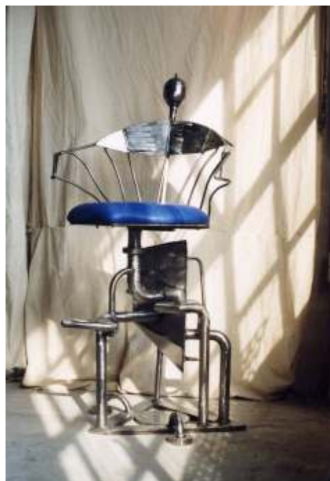
Hokery zdobione wnętrza klubu NAUTILUS w Getyndze.