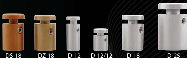
DYSTANSE Z TWORZYWA

Poprawnym, (praktycznym i estetycznym) rozwiązaniem mocowania tablic, tabliczek na ścianach i elewacjach, jest zastosowanie dystansów (zalecanych przez architektów). Do zawieszania tabliczek z tworzywa z powodzeniem można stosować dystanse z tworzywa. Oferujemy dystanse stalowe, aluminiowe i z tworzywa.