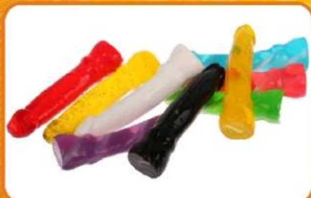
MYDŁO PENIS To nietypowe mydło, o ilez zabawniejsze od wielu innych z pewnością wnieśli wiele dobrego humoru do każdej łazienki. Biorąc pod uwagę zapach i kształt baaardzo podoba się wszystkim Kobietom.