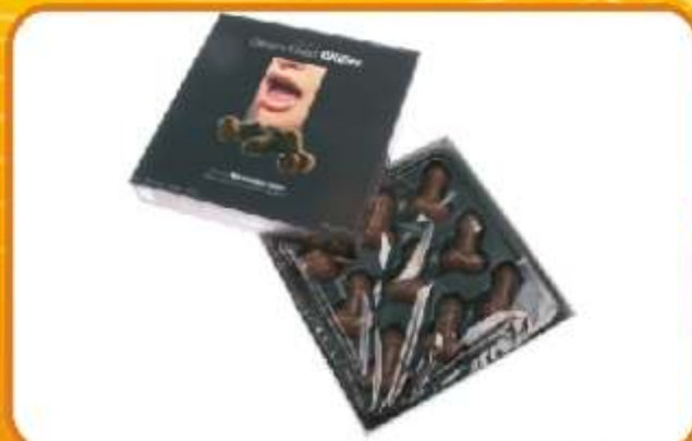
CZEKOLADOWE PENISKI Z NADZIENIEM Ekskluzywna bombonierka z niezwykłą zawartością! Trudno o lepszy prezent dla dziewczyny! Czekoladowe peniski z mlecznej czekolady zawierają słodkie, białawe nasie...nadszenie, które po prostu rozplwya się wuściach.