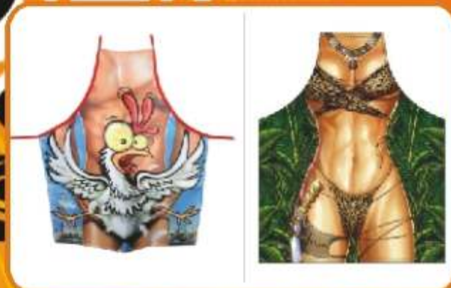
FARTUSZKI - MIX WZORÓW Revelacyjny fartuszek z dowcipnym wzorem. Fartuszek wykonany jest z płamo-odpornej tkaniny poliestrowej nadrukowanej transferowym drukiem sublimacyjnym. W przedwzrostwie do chińskich podróbek druk jest trwały.