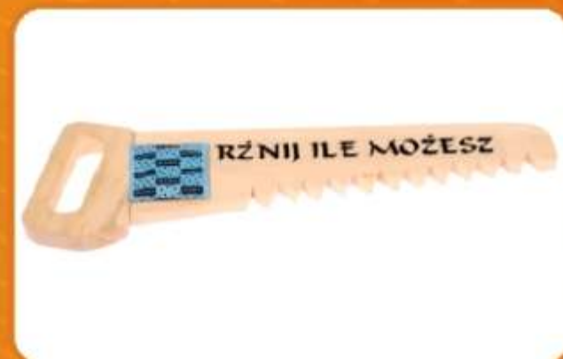
PIŁA DO RZNIĘCIA Odjechana, drewniana piła z napisem RZNIJ ILE MOŻESZ. Gratis dołączona prezerwatywa. Prezent z "prześcieniem" autora do indywidualnej interpretacji. Podobno świetny prezent od Kobiety dla Mężczyzny bowiem gwarantuje świetną zabawę.