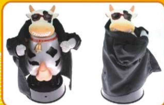
BYCZEK EKSHIBICJONISTA Rozbawi każdego smutasa, nawet największego. Byczek jest aktywowany kłasnieniem lub uderzeniem np. w stół. Byczek zaczyna muczeć jak krowa, następnie rozchyła płaszcz i jedkuje po bawarsku trzęsąc wackiem.