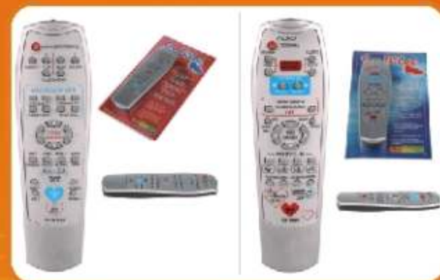
PILOT DO STEROWNIA KOBIETA / MĘŻCZYŻNA Jeśli ukochana przez Was osoba nie chce spełniać waszych zachcianek to znak że należy włączyć sprawę w swoje ręce. Najłatwiej osiągniemy ten cel używając specjalnego pilota do sterowania drugim człowiekiem.