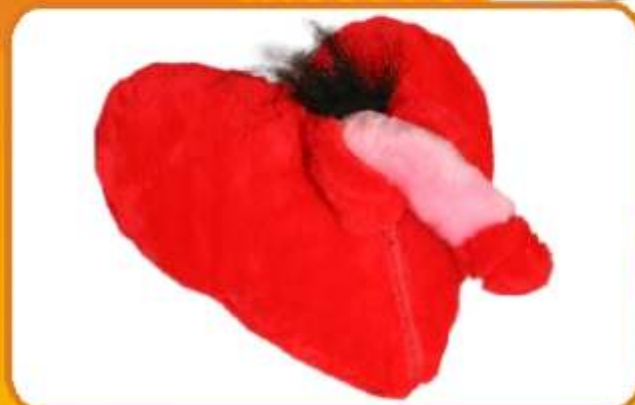
PODUSZKA SERCE DLA PAŃ / PANÓW Pluszowe serce z penisem w środku dla Pań oraz w wersji dla Panówno chyba wiadomo z czym z jednej strony zwykłe serce. Z drugiej suwak, a pod nim przyjemna niespodzianka.