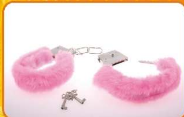
KAJDANKI Z FUTERKIEM Revelacyjne, metalowe kajdanki. Pokryte puszystym futerkiem. Znakomicie sprawdzą się jako prezent lub jako dodatek do szalonych wieczorów w dwójce.