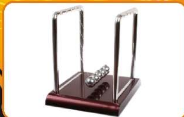
KULKI NEWTONA Bardzo ładny gadżet, który ma walory edukacyjne! Zasada działania oparta na wzorcu Newtona. Obrazuje zasadę zachowania energii kinetycznej oraz pędu!