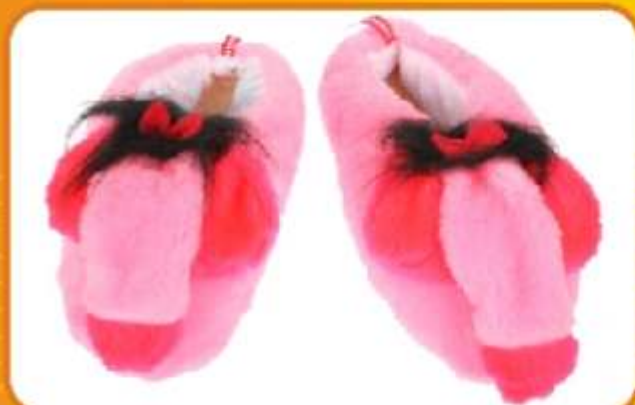
KAPCIE Z PENISEM Idealne dla każdej Kobiety. Zabawne i praktyczne. Stopy każdej Kobiety z pewnością polubią dotyk ciepłego i międkiego pantofelka.