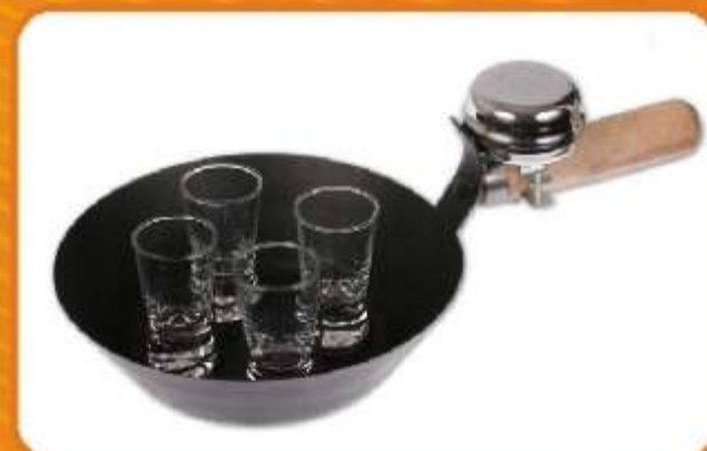
IMPREZOWA PATELNIĄZ KIELUSZKAMI Jeżeli znudził Ci się standardowy sposób serwowania napojów wysokowych ta patelnia jest dla Ciebie. Nawet na hucznej imprezie oznajmisz gościom dzwoniem, że czas na białaczka!