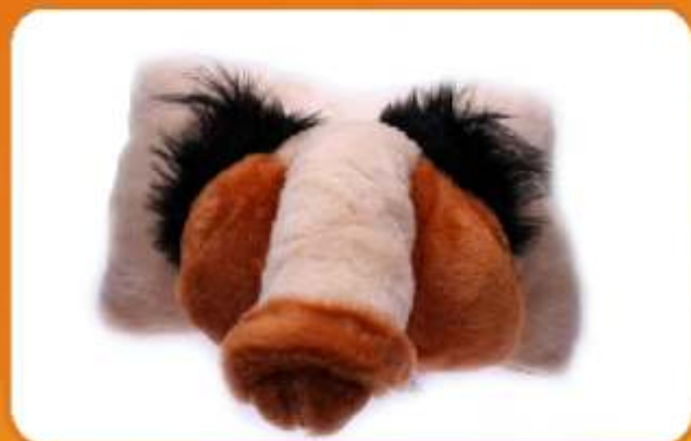
PODUSZKA PENIS Super Poducha zPenisem! Panie uwielbiają takie gadzety. Miłutka w dotyku przytulanka z prawdziwego pluszu. Do wyboru duża poduszka oraz mniejsza w kolorze różowym.